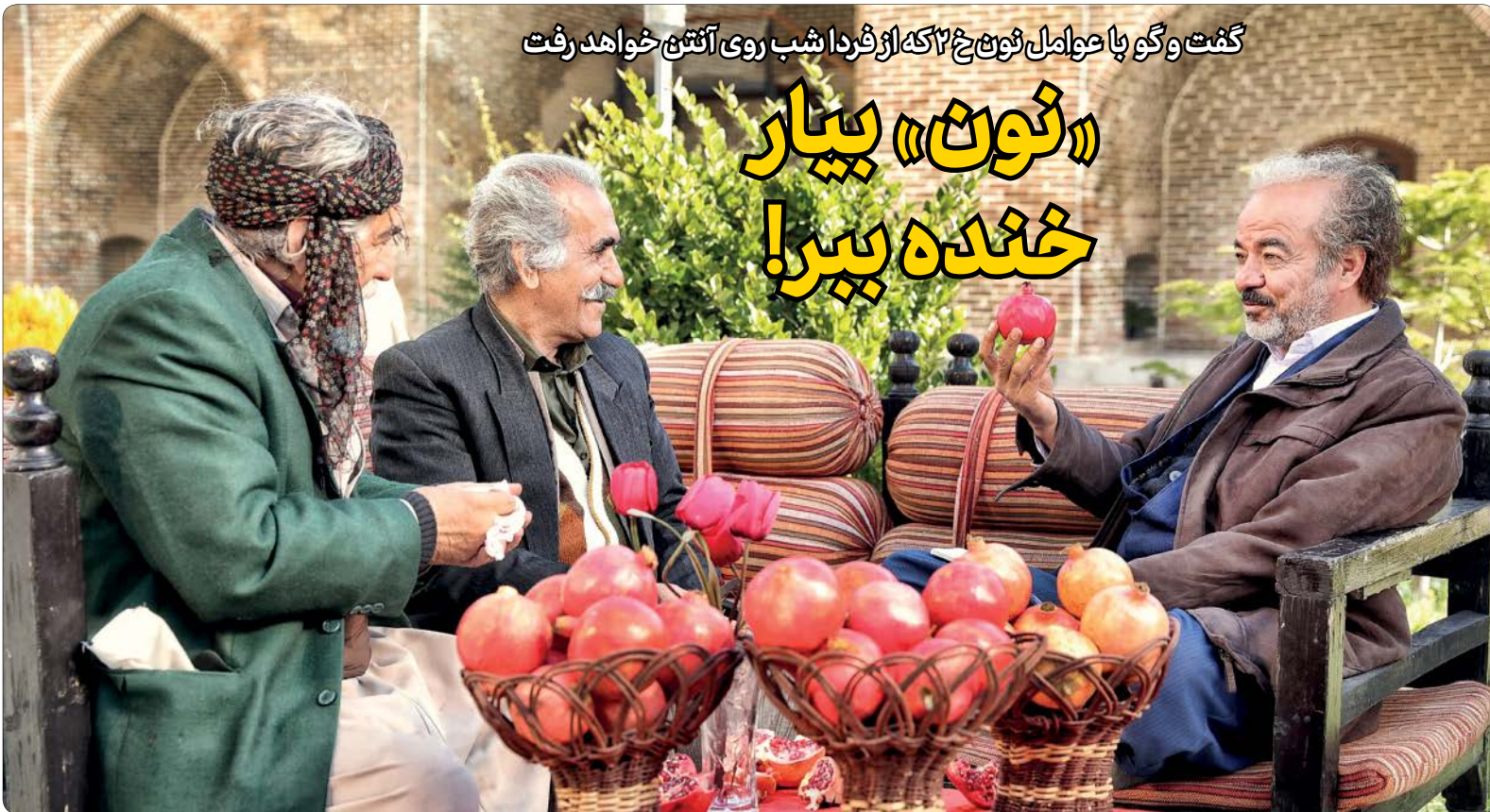
گفت و گو با عوامل نون‌خ که از فردا شب روی آنتن خواهند رفت