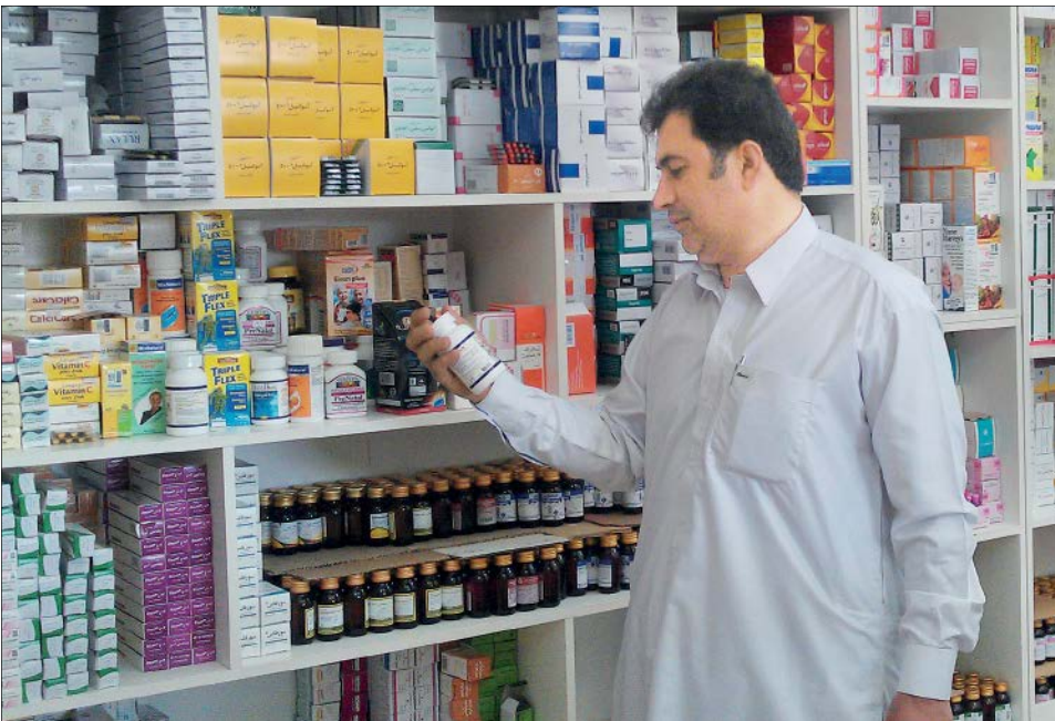
به‌جای رانیتیدین از داروهای جایگزین استفاده کنید