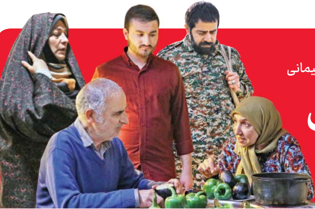
نگاهی به مستند تازه برای سالگرد شهید سلیمانی