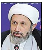
رئیس‌جمهور محترم کشورمان آیت‌الله محمد خاتمی

بدیهی است نادیده گرفتن نهادهای فرهنگی بین‌المللی نظام و شبکه‌های مردمی جنبه فرهنگی انقلاب که در حوزه بین‌الملل فعال هستند، در اسنادی نظیر سند تحول شریعتی انقلاب فرهنگی می‌تواند به پاشنه آشیل اجرایی شدن به نهادهای فرهنگی کشور ابلاغ کرده‌اند. این سند در واقع «سند جامع تحول فرهنگی کشور» است. بدیهی است که چنین اقدام مهم مبارک، نهادهای فرهنگی کشور و کارکردها و خروجی عملکرد آنها را در یک مدار منظم و پایدار قرار می‌دهد. این نگاه منظومه‌وار و هم‌گرایانه، پیش‌نیاز اصلی موفقیت نظام عزیزمان در عرصه فرهنگ محسوب می‌شود. ابلاغ این سند، نگاه زیربنایی نسبت به حوزه فرهنگ را مورد تأکید قرار می‌دهد. ماهیت انقلاب اسلامی و نظام برخاسته از بنیان انقلاب مقدس، اساساً اجازه نمی‌دهد «فرهنگ» به مقوله‌ای انتزاعی یا متغیری وابسته به دیگر مؤلفه‌های قدرت تبدیل شود. مهم‌تر این که تدوین و ابلاغ سند طرح تحول شریعتی عالی انقلاب فرهنگی متعاقب مطالبه رهبر معظم انقلاب اسلامی و در سه حوزه «شناختی»، «نهادی» و «فرآیندی» صورت گرفته است. این نگاه جامع، انعکاس‌دهنده نگاه عمل‌گرایانه به عرصه فرهنگ است، دقیقاً همان نگاه و رویکردی که در عرصه «جهاد تبیین» و «مواجهه با جنگ شناختی دشمنان» به آن نیاز مبرمی داریم.