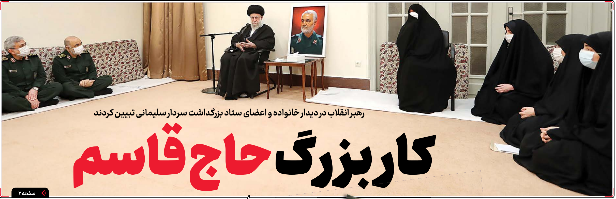
رهبر انقلاب در دیدار خانواده و اعضای ستاد بزرگداشت سردار سلیمانی تبیین کردند