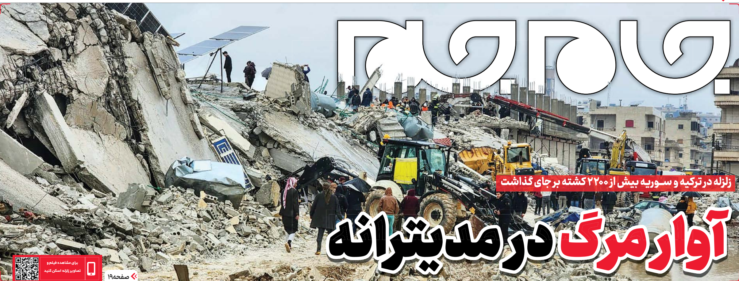
زلزله در ترکیه و سوریه بیش از ۲۲۰۰ کشته بر جای گذاشت