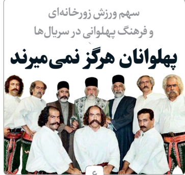
سهام ورزش زورخانه‌ای و فرهنگ پهلوانی در سریال‌ها پهلوانان هرگز نمی‌میرند

پنجشنبه ۲۹ اردیبهشت ماه ۱۴۰۱ روزنامه فرهنگی-اجتماعی صبح ایران، ۱۷ شوال ۱۴۴۳ ۲۰ صفحه، سال بیست و سوم شماره ۶۲۱۷، قیمت در استان تهران و البرز ۳۵۰۰ تومان و دیگر استان‌ها ۲۵۰۰ تومان Thursday - May 19, 2022