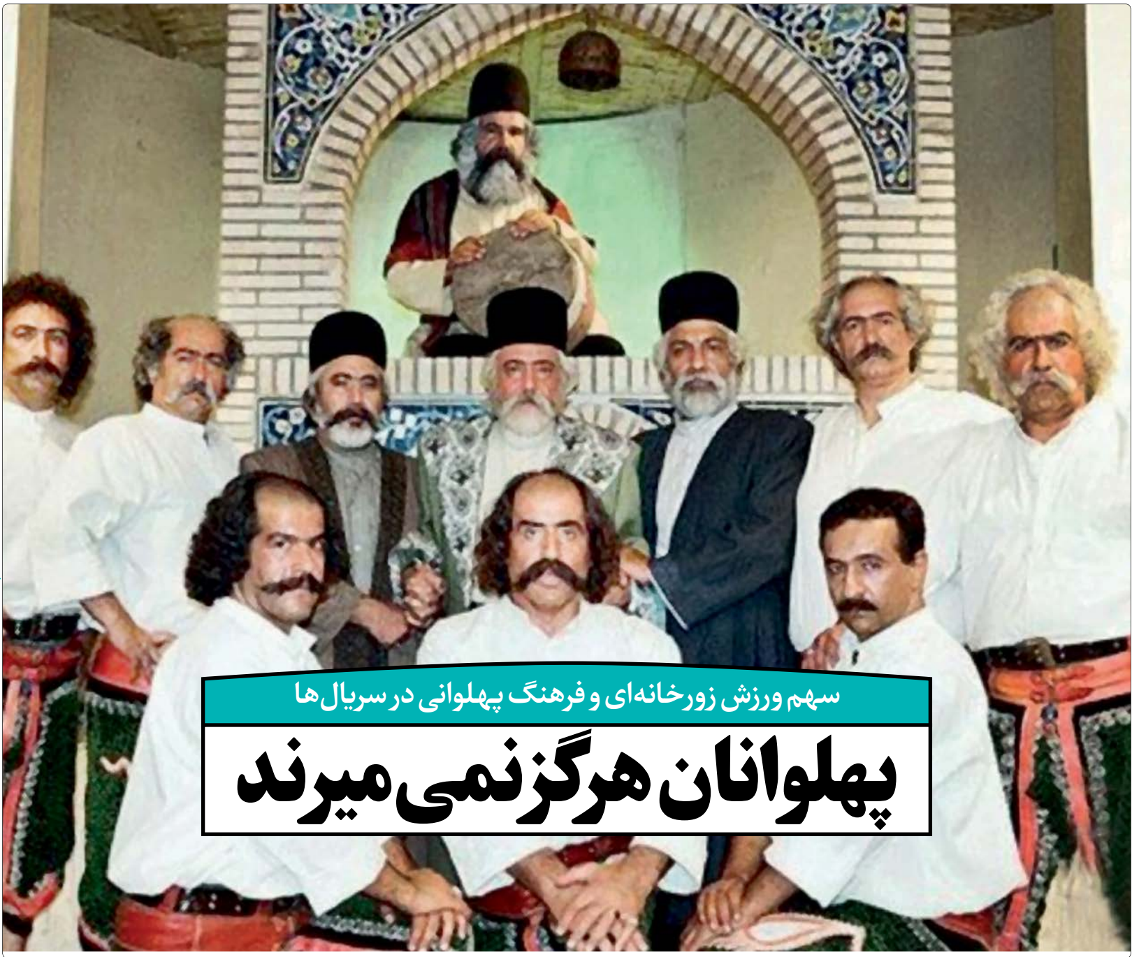
فرهنگ پهلوانی و ورزش زورخانه‌ای از محورهای سریال «پهلوانان نمی‌میرند» بود

باید با جوان رفاقت کرد و این رفاقت در سریال‌ها و برنامه‌های تلویزیونی میسر نمی‌شود مگر با شنیدن و انعکاس بی‌واسطه حرف‌های او. باید جوانان خودشان را در کارهایی که روی آنتن می‌رود، ببینند. بگذاریم تمام زوایای یک اتفاق در برنامه‌های تلویزیونی تحلیل شود و این قدر به دنبال نتیجه‌گیری له یا علیه یک جریان نباشیم. سریال تلویزیونی باید سوزهای روز را با پرداخت‌های دقیق به مردم ارائه کند تا هم‌دلی مردم برانگیخته شده و به تلویزیون اعتماد کنند و این کار هم می‌تواند با کمک خاطره‌سازان قدیم و جدید صورت پذیرد و به سمتی برویم که محصولات با غنای بالا به عمل آید.