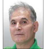
کیکوسو یاری گروه فرهنگ و هنر

اتحادیه بین‌المللی ناشران، نمایندگی بیش از ۶۰ اتحادیه نشر کتاب را در سراسر گیتی به‌عهده دارد و از متن منتشر شده توسط این اتحادیه می‌توان متوجه دغدغه‌های جدی ناشران کتاب در نقاط مختلف جهان شد. در صنعت نشر کتاب، حرف اصلی را فقط ناشران نمی‌زنند و جماعت کتابخوان هم نقشی برابر با آنها دارند. به همین دلیل گزارش اتحادیه تلاش کرده نظرات