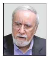
سید مرتضی میرحسین موسوی

منطقه غرب آسیا، تحولات مختلفی را تاکنون به خود دیده و برخی از اتفاقات و رویدادها هم، باعث بروز ناامنی در منطقه شده است. طبعاً برای حل مشکلات و برون رفت از بحران و اختلاف نظر، دو شیوه برخورد وجود دارد. رویکرد اول، استفاده از زور است که البته تجربه نشان می دهد، تنها باعث پیوسته شرایط در منطقه