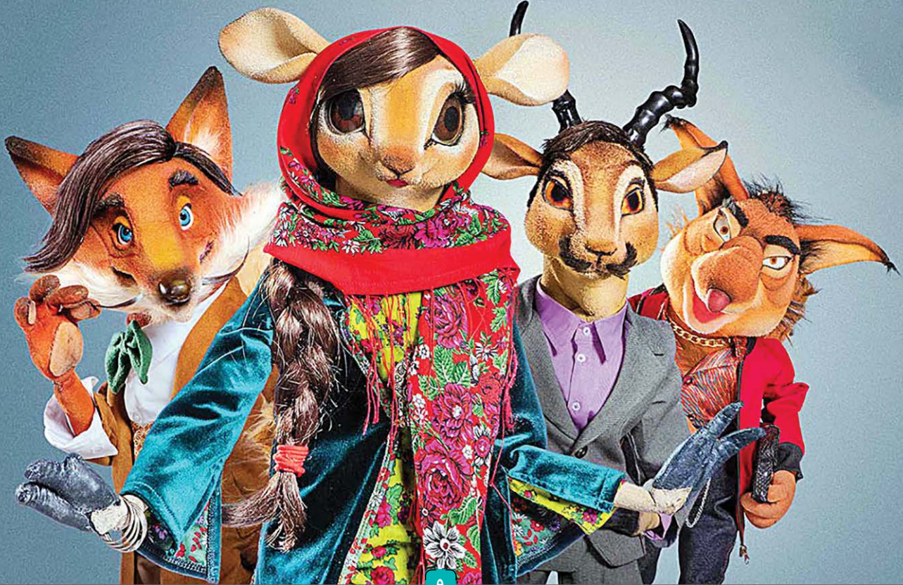
انتشار کلیپ از شهریک کلپله و دمنه، جنجال افروخته شده است