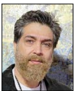
یوسف مرادیان بازیگر سینما و تلویزیون

من تا به امروز نقش های بسیاری بازی کرده ام و برایم نقش مثبت یا منفی تفاوت ندارد. آنچه برایم اهمیت دارد این است که نقشم در شکل گیری درام قسه موثر باشد و شخصیتی را بازی کنم که برایم جای کار بسیاری داشته باشد. بنابراین علاقه مندم نقش های متفاوت را بیشتر ایفا کنم. البته تا امروز تجربه گرایی داشتم و از این به بعد باید نقش هایی را بپذیرم که برایم جای کار بیشتری بگذارد؛ به ویژه در سریال های تلویزیونی که مخاطبان بسیاری دارد. وقتی سریال تاریخی خودش را برای مخاطب داشته باشد می تواند در همان قسمت های ابتدایی مخاطب را جلب و کاری کند که مخاطب خودش به مبلغ اثر تبدیل شود.