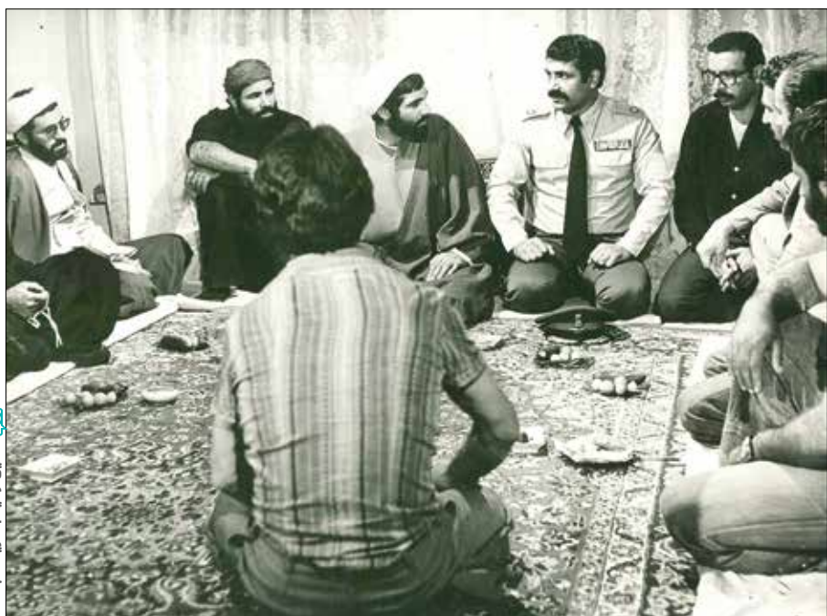
نمایی از فیلم «فریاد مجاهد»

قرار بود بخشی از تاریخ نهضت امام از جمله حمله به مدرسه فیضیه در سال ۱۳۴۲ و تبعید امام و همچنین ماجرای پس از آن را به تصویر بکشد اما حاصل کار، برداشتی سطحی از انقلاب و مبارزات مردم و رهبری آن و با همان ساختار مبتذل فیلمفارسی بود. گرچه مسئولان سینمایی وقت، هیچ‌گونه مجوزی برای ساخت و تولید فیلم فریاد مجاهد صادر نکرده بودند اما هیچ اقدامی هم برای جلوگیری از نمایش آن به عمل نی‌آوردند و بالاخره پس از اعتراضات فراوان مردمی، فیلم فریاد مجاهد که از دوم شهریور ۱۳۵۸ اکران شده بود، از یازدهم شهریور از پرده پایین کشیده شد. البته قبل از آن نیز یک شورای بررسی فیلم (مشابه شورای پروانه نمایش کنونی) مرکب از فیلمسازانی همچون مسعود کیمیایی، امیر نادری، کامران شیردل و داریوش مهرجویی و ... درباره نمایش فیلم فریاد مجاهد نظر منفی ابراز داشته و براساس نظر آنها، صادق قطب‌زاده (رئیس وقت سازمان صداوسیما که بعداً به دلیل شرکت در کودتای ضد انقلابی اعدام شد)، به شدت به دنبال توقیف فیلم بود. اما پس از مدتی و با بازبینی مجدد فیلم توسط دادستانی وقت، دوباره اجازه نمایش گرفت و از تاریخ ۲۳ آبان ۱۳۵۸ روی پرده سینماها رفت. در آن روزها و قبل از این‌که طرح و برنامه‌ای برای سینمای پس از انقلاب تدارک دیده شود، به طور ضرب‌الاجل تعدادی فیلم که در روزهای پیش از انقلاب ساخته شده ولی مجال نمایش عمومی پیدا نکرده بودند، بازبینی و آنها که مغایرت چندانی با مبارزات مردم نداشت یا به رژیم سابق ارتباطی پیدا نمی‌کردند، با حذف برخی صحنه‌های نامناسب از نظر موازین انقلابی و اسلامی، پروانه نمایش گرفت و در سینماها نمایش داده شدند.