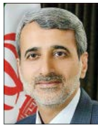
عباس مقصدی ناظر بر رئیس کمیسیون امنیت ملی و سیاست خارجی