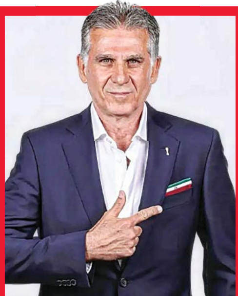
«جام جم» از آخرین تحولات تیم ملی گزارش می دهد