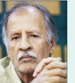
محمدتقی فهیم نویسنده و منتقد سینما