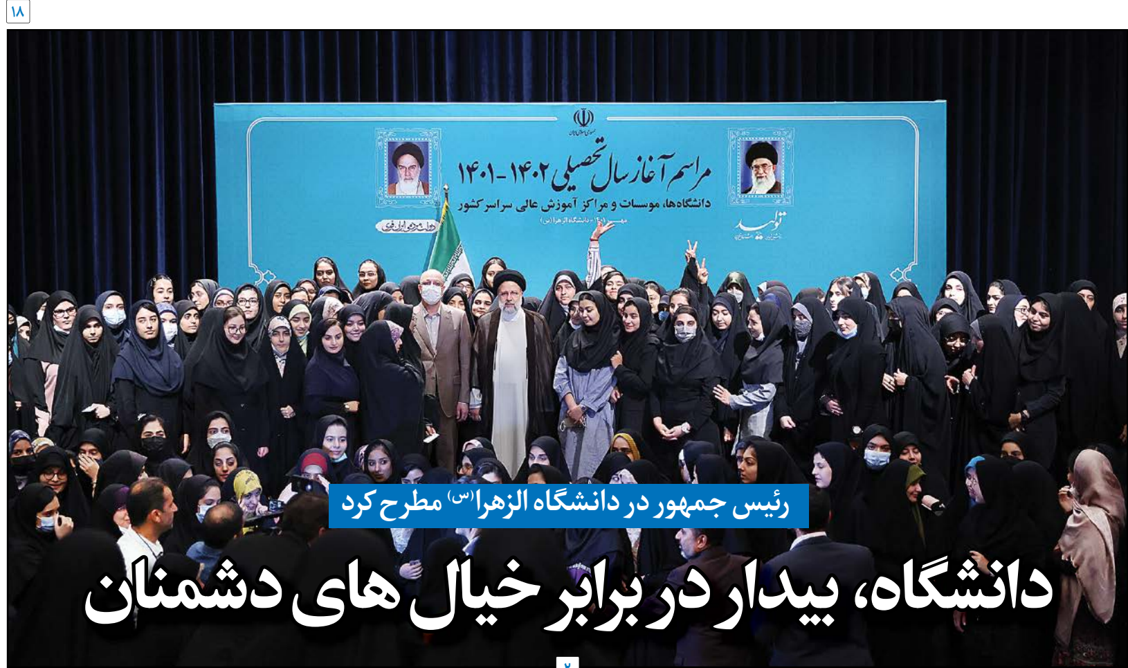
رئیس جمهور در دانشگاه الزهرا (س) مطرح کرد

■ فرانسوی‌ها در حالی ایران را متهم به نقض حقوق بشر می‌کنند که خود پرونده قطوری در این زمینه دارند