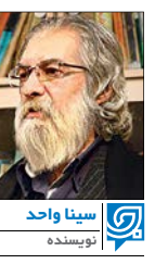
سینا واحد نویسنده

ناگهان، دستی، بالا رفت؛ و صدای دلپره‌آمیز یک «شلیک»، سایه ترس و تلخ خویش، را چونان ابر سیاه بی حرکتی، بر، سر آزادترین شهر دنیا «نیویورک» پهن کرد؛ تا صدای یک «آوازه‌خوان» از خط خارج شده را، برای همیشه، به زیر خاک بفرستند؛ و به «آوازه‌خوانان» دیگر هم، پیام بدهد؛ که هر «ترانه» و «آوازی» را، در زادگاه بزرگ آزادی و اندیشه دموکراسی، یعنی «نیویورک» نمی‌توان خواند، و چنین شد که؛ «جان لنون»، «پایگنار گروه موسیقی «بیتل‌ها»؛ به دست یک «دیوانه» ترور شد؛ تا تولید «آوازه‌های ضد جنگ آمریکایی - انگلیسی» او، متوقف شود و «صلح» و «جهان بدون جنگ»، هنرمندی دیگر، سخن نگوید. این هنرمند فراری از انگلیس و فراری از «ملکه الیزابت عروس‌کش»، که طنین آوازه‌هایش، سیاست‌های جهانی جنگ‌افروزانه را، با پریش‌های «اعتراض‌گرانه» همراه کرده بود؛ باید، خاموش می‌شد؛ که شد؛ اما، چرا و به چه دلیل «دوستان نزدیک» او، که آنان هم، همانند «جان لنون» هم «گیتار» می‌نواختند و هم آواز می‌خواندند، سکوت کردند و با سکوت‌شان، اجازه دادند، بزرگ‌ترین دروغ‌ها، درباره مرگ و ترور برنامه‌ریزی شده «جان لنون» در جهان منتشر شود و باز هم «سازمان عقرب‌ها» یا «سازمان سیاه»، در خیمه مصونیت از «ترور آدم‌کشی» مقیم شوند و به «کشت و کشتار» در جهان فرهنگ، هنر و اندیشه بپردازند؟! یکی از این دوستان خوشنام، هنرمند معروف «راجر واترز» طرفدار صلح و ضد جنگ و ضد خشونت است، یکی از پایه‌گذاران گروه «بینگ فلوید»، آقای راجر واترز، نخستین بار، درباره «ندا افساطلان»، وارد دایره جهانی مخالفان و محکوم‌کنندگان دولت و جامعه ایرانی، شد و