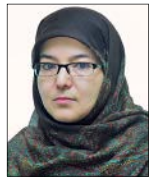
نازلی مروت گروه فرهنگ

هفته وحدت فرصتی برای بازخوانی اندیشه‌های تقریبی بزرگان جهان اسلام و توجه به آموزه‌های دینی در این رابطه است. اولین کسی که دستور به حفظ وحدت و تقریب افکار و اندیشه‌ها را صادر کرد، خداوند متعال است. احادیث نبوی و سیره عملی پیامبر در برقراری پیمان برادری بین انصار و مهاجران نمونه بارزی از وحدت عملی در صدر اسلام است. درس‌های سیره نبوی و ائمه اطهار در این رابطه برای جهان اسلام در دنیای کنونی که تعدد مذاهب، تکثر قومیت‌ها و ملل بیش از آن ايام است، راهنمای خوبی برای تحقق تقرب مذاهب و زیست مسالمت‌آمیز مسلمین است. ماموستا دکتر عابد نقیبی در گفت‌وگو با جام جم از آسیب‌های علمی ضد وحدت می‌گوید و این‌که امروز بیش از هر زمان دیگر نیازمند بهره‌مندی از همه ابزارها برای محکم کردن پیوند برادری هستیم. ماموستا دکتر عابد نقیبی، عضو شورای علمای جهان اسلام، از علمای شافعی‌مذهب کردستان، استاد دانشگاه و پژوهشگر تقرب مذاهب اسلامی است.