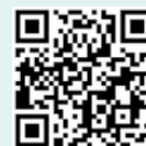
برای دیدن فیلم صحبت‌های «مربی» من و تو به این QR کد اسکن کنید