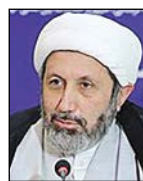
رئیس سازمان فرهنگ و ارتباطات اسلامی

فرارسیدن ولادت پیامبر اعظم ﷺ و هفته وحدت، فرصتی مبارک برای بازخوانی شخصیت پیامبر عظیم‌الشان اسلام و نسبت ایشان با مسلمانان و حتی پیروان دیگر ادیان الهی و آسمانی است. پیامبر گرامی اسلام، حضرت محمد ﷺ، به نص قرآن کریم «رحمه للعالمین» است؛ یعنی غنای وجودی و رحمت نهفته در تعالیم پربر و انسان‌ساز ایشان معطوف به همه عالمیان در همه اعصار است و «زمان» و «مکان» در این عرصه معنایی ندارد. نبوت پیامبر خاتم ﷺ همچنان بشریت را به سوی کشف حقیقت هستی و مسیر رستگاری رهنمون می‌سازد.