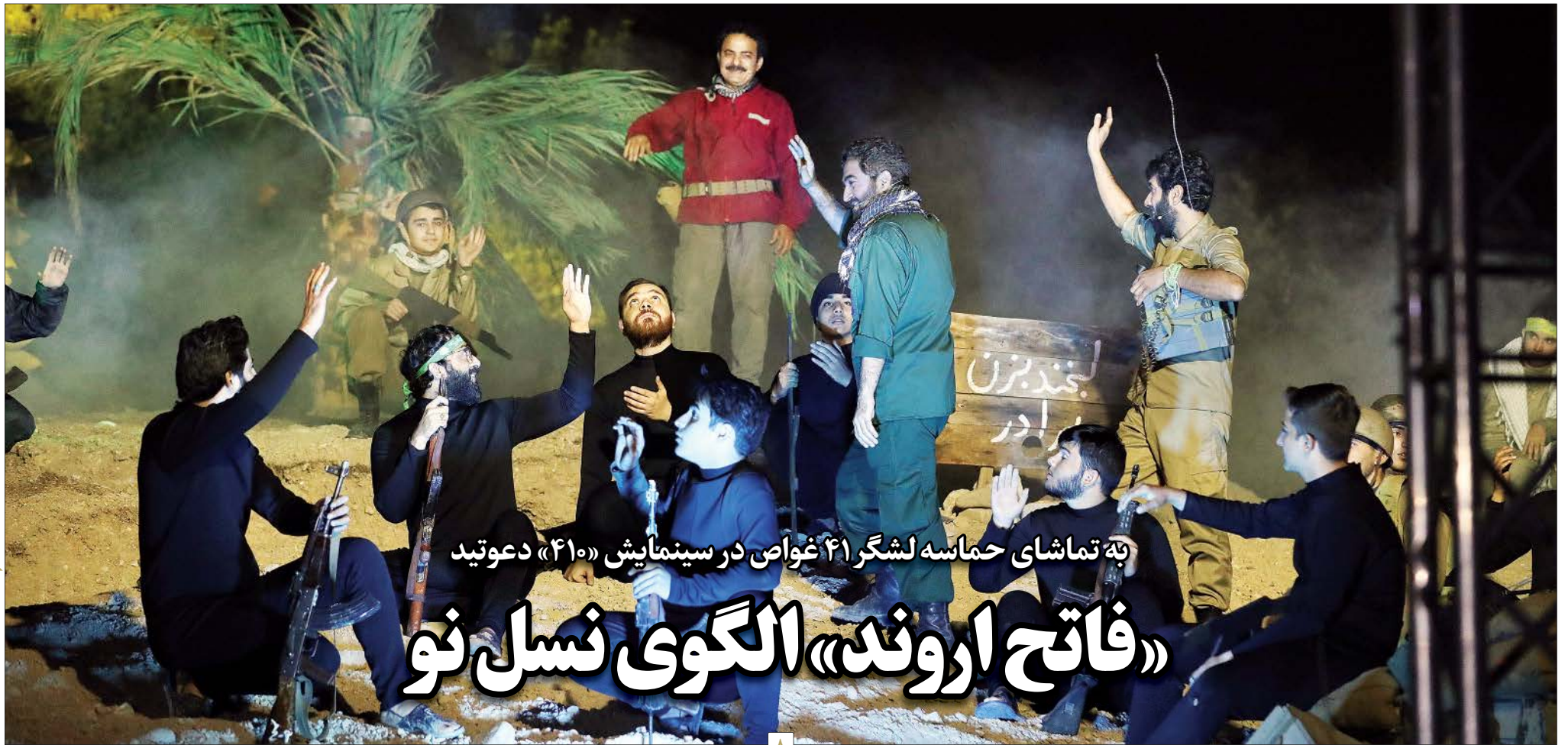
بته تماشای حماسه لشکر ۴۱ غواص در سینمایش «۴۱» دعوتید