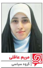
مریم عاقلی گروه سیاسی

بعد از خبر جدیدی که سردار حاجی زاده همزمان با سالگرد شهادت سردار طهرانی مقدم، پدر موشکی ایران اعلام کرد، حالا دیگر فاصله تهران تا پایگاه هسته ای دیمونا به عنوان قلب هسته ای رژیم صهیونیستی از طریق موشک بالستیک هایپرسونیک پیشرفته به کمتر از هفت دقیقه در مقایسه با موشک سرجیل رسیده است. فرمانده نیروی هوافضای سپاه همچین از انجام آزمایش های موشک بالستیک هایپرسونیک خبر داد و گفت این موشک در آینده نزدیک و در یک فرصت مناسب رونمایی می شود.