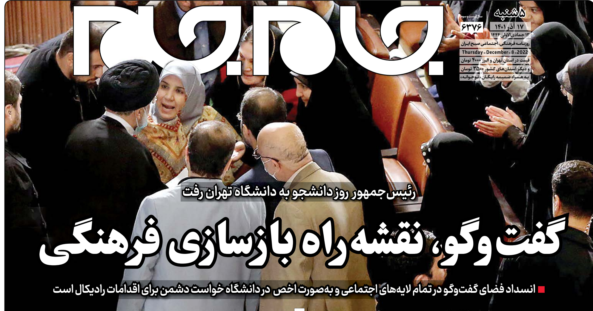
رئیس جمهور روز دانشجو به دانشگاه تهران رفت