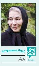
پروانه معصومی بازیگر