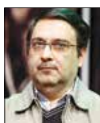
محمدحسین نیریومنده هنرمند مطرح و کاریکاتوریست

فیلم «زمین‌شکار» (Hunting Ground) ساخته کریس دیک محصول ۲۰۱۵، با شادی و خوشحالی تعدادی از داوطلبان تحصیل در دوره آموزش عالی برخی دانشگاه‌های معتبر آمریکا که متوجه می‌شوند در دانشگاه مربوط قبول شده‌اند، شروع می‌شود. آنها پس از دریافت خبر قبولی خود در دانشگاه به طرز غیرمعمولی به همراه دوستان و خانواده‌شان، شادی کرده و به هوا می‌پرند و از خوشحالی در پوست خود نمی‌گنجند. دانشگاه‌های مختلفی در سراسر آمریکا، آماده پذیرش آنها شده‌اند، دانشگاه‌هایی که ورود به هر کدام از آنها شاید آرزوی هر جوان طالب تحصیلات عالی در سراسر دنیا باشد... دانشگاه‌هایی مانند هاروارد، کارولینای شمالی، برکلی، فلوریدا، می‌سی‌سی‌پی، ییل، پرینستون و ... سپس همراه حرکت فوج دانشجویان به سمت این دانشگاه‌ها، سخنان برخی مسئولان آنها را می‌شنویم که گویا در روز آغاز سال جدید تحصیلی برای دانشجویان به اصطلاح سال اولی ایراد کرده‌اند. یکی از آنها می‌گوید: «مصلان جدید، امروز که به شما نگاه می‌کنم، متوجه احساس و هیجان فوق‌العاده، آینده‌نگری و شاید کمی احساس آرامش می‌شوم، امروز همان روز است، همان طور که والدین شما امروز شما را اینجا بدرقه کردند تجربه دارند.»