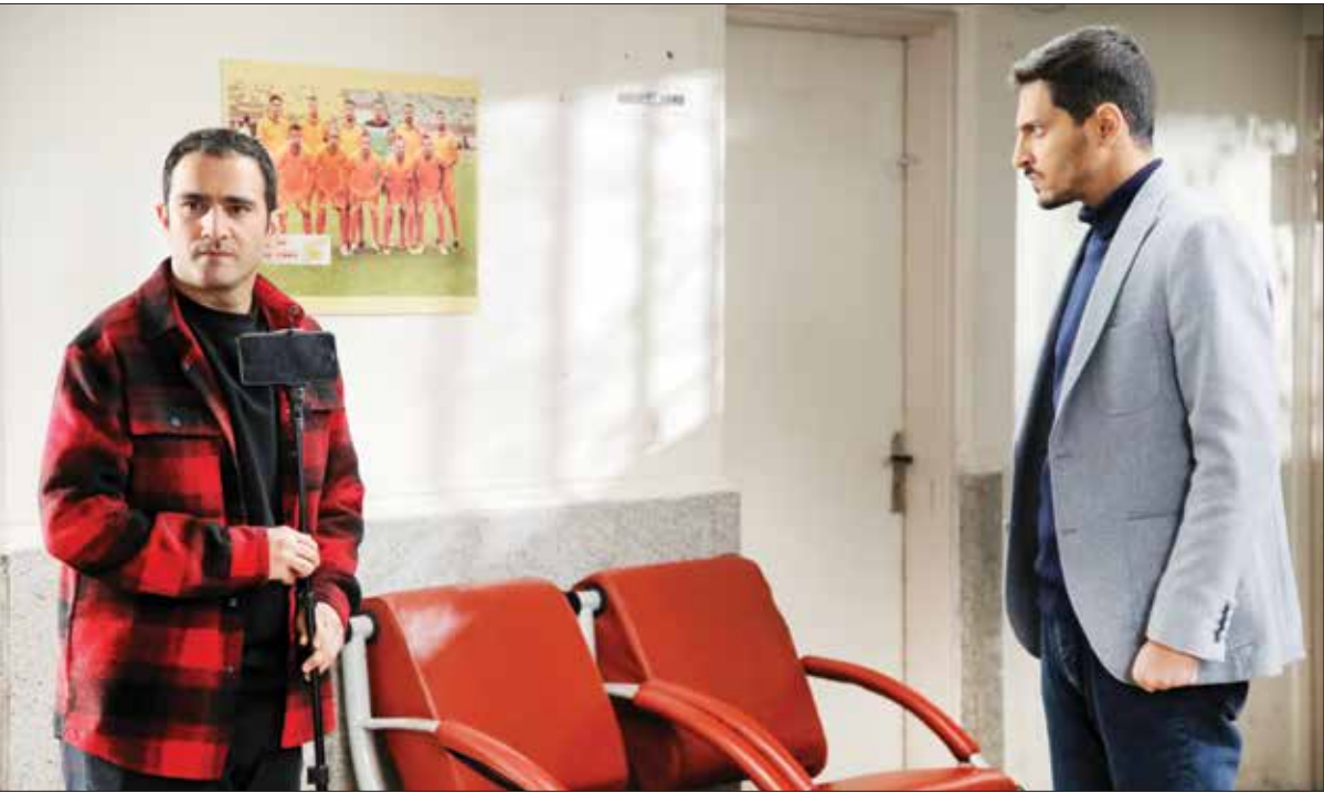
چهل و دومین جشنواره فیلم فجر بود.